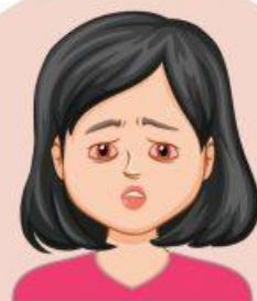
Người bệnh hoặc người nghi bị đau mắt đỏ

✗ Hạn chế tiếp xúc với bệnh nhân hoặc người nghi bị đau mắt đỏ