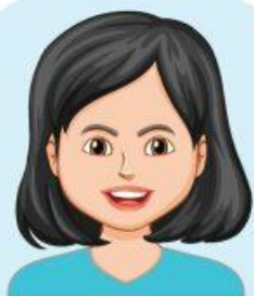
Người không bị bệnh